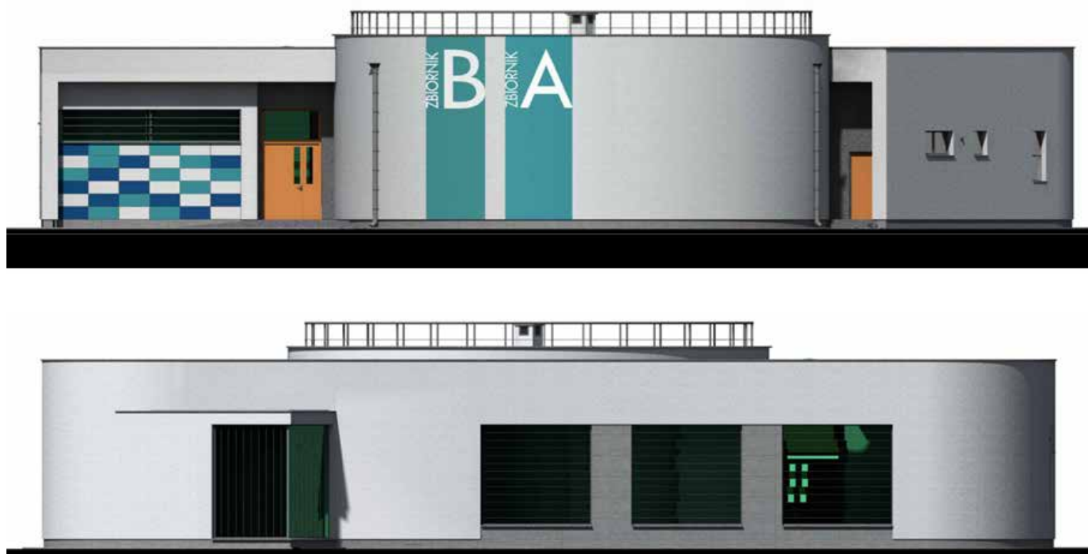
Fot. 1 – Projekt techniczno – architektoniczny SUW Suchocin

Na przełomie roku GPK Eko Jabłonna Sp. z o.o. rozpoczęło budowę sieci wodociągowej w ulicy Paderewskiego w Jabłonie (od Chotomowskiej do Królewskiej). Do końca pierwszego kwartału sieć ta zostanie wybudowana i uruchomiona, a do wszystkich, bocznych ulic wykonane odcinki, które w przyszłości umożliwią zwodociągowanie całego tego obszaru.